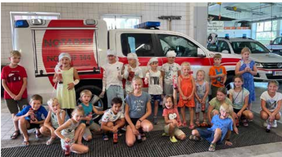
Besuch beim Roten Kreuz mit der Frauenwerkstatt

Doch schon eine Woche später trafen sich über 20 begeisterte Dinofans im Dinoland. Wie durch Zauberei (oder wars doch der Pfarrgemeinderat ?) wurde unser schöner Pfarrhof von den riesigen und faszinierenden Urzeittieren bevölkert.