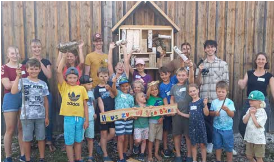
Der Arbeitskreis Ökologie baute das Haus „zur wilden Biene“