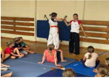
Das Schnuppertraining zur Selbstverteidigung mit der Union kam sehr gut an.