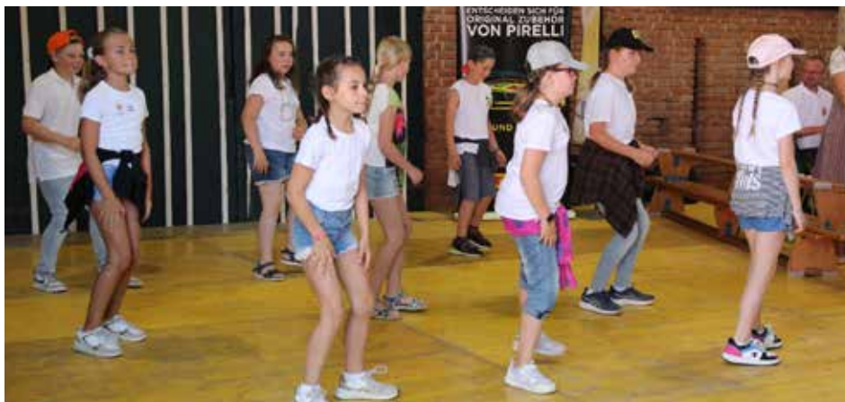
Die Tänzer:innen der Volksschule Pollham