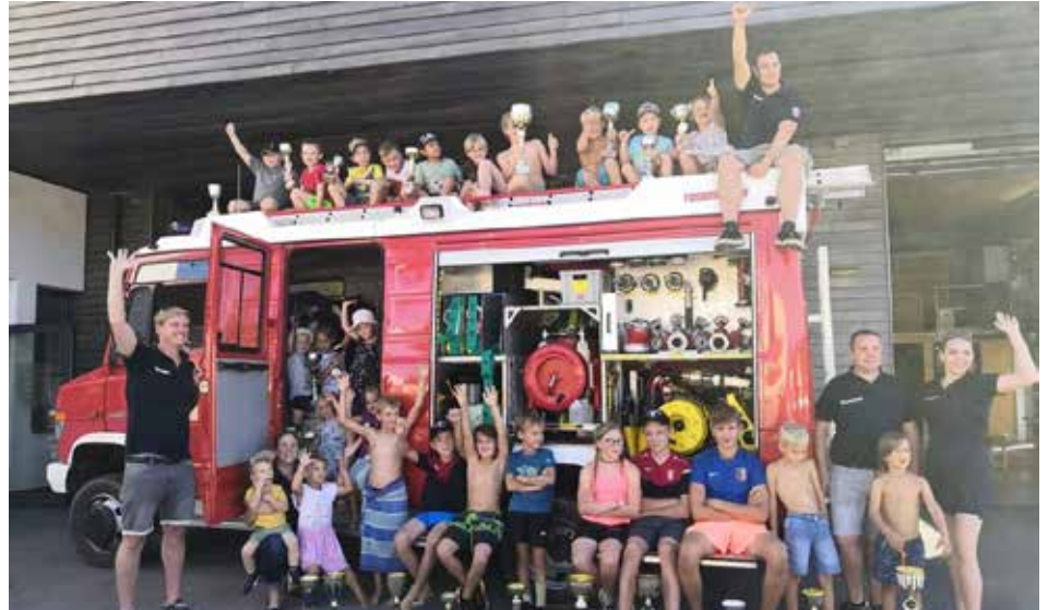
Spiel und Spaß mit der Feuerwehr