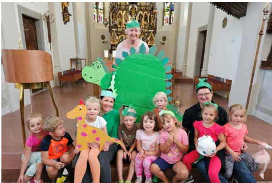
Mit der Pfarrgemeinde ins Dinoland

Gäste sind Wildbienen, von der gehörnten Mauerbiene bis zur Buckelseidenbiene. Zu bewundern ist das Hotel auf der Rückseite des Dorfstadels.