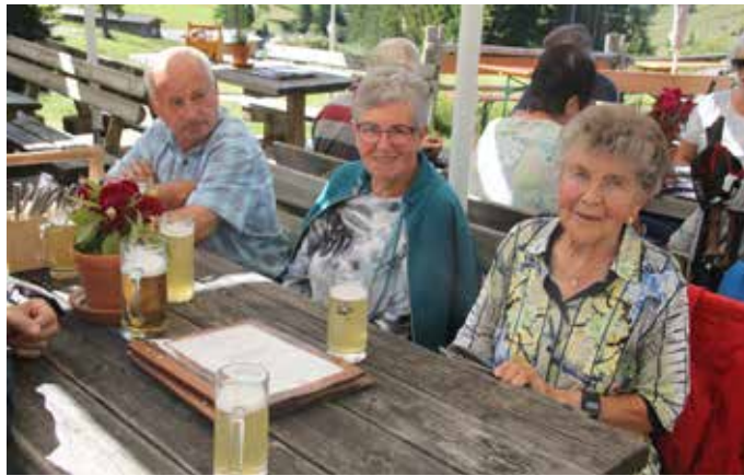
Filzmoos, 19. September 2025

Der letzte Ausflug dieses Jahres führte uns nach Filzmoos auf die Unterhofalm. Am 19. September 2025 verbrachten 39 Senior*innen einen wunderbaren Spätsommertag auf der Alm. Die Anreise führte über Lizen und Schladming nach Filzmoos. Um 11 Uhr erreichten wir die auf 1280 m hoch gelegene Unterhofalm, dort ließen wir uns das Mittagessen schmecken.