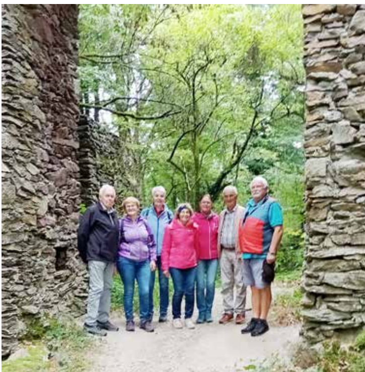
St. Agatha, 17. September 2025

Der Seniorenbund Pollham wünscht allen gesegnete Weihnachten und alles Gute für das neue Jahr 2026.