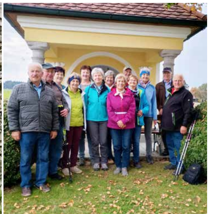
Prambachkirchen, 15. Oktober 2025