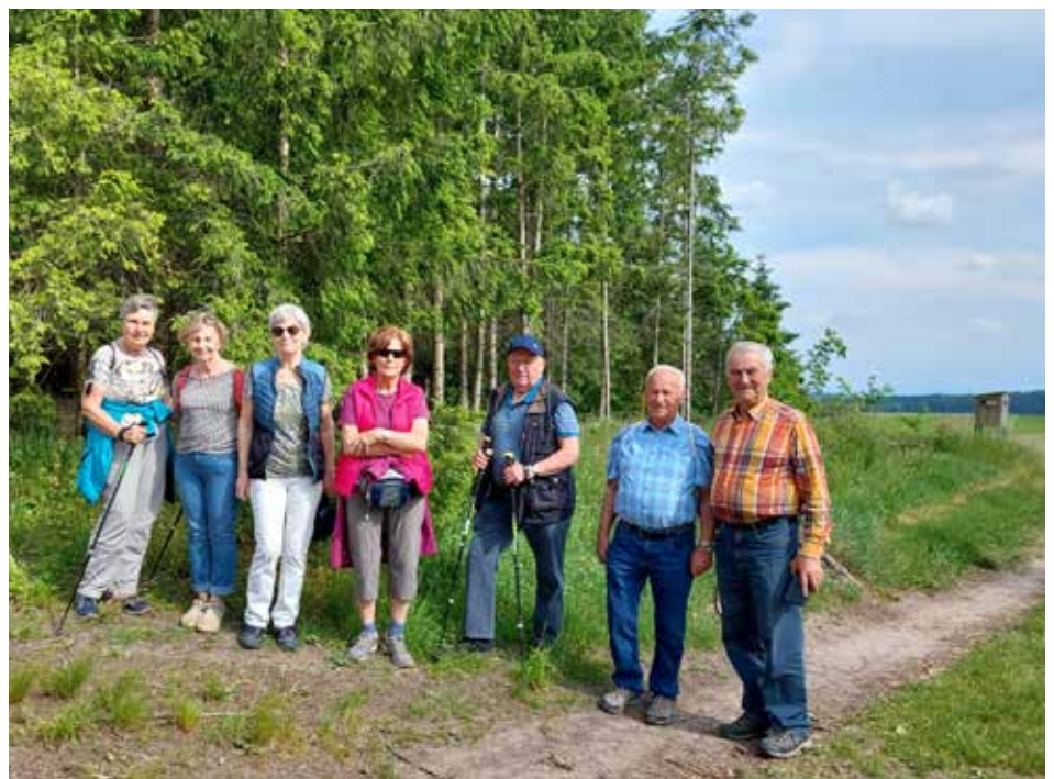
Wanderung 21. Mai 2025