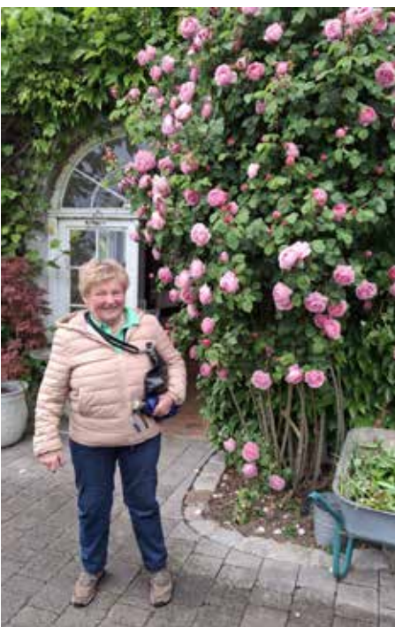
Garten der Geheimnisse 28. Mai 2025

Mit 22 Teilnehm*innen fuhren wir am 28. Mai 2025 nach Stroheim. Wir hatten Glück, dass gerade die Pfingstrosen in voller Blüte standen. Die 20.000 m 2 große Anlage ist traumhaft. Leider spielte das Wetter nicht mit, sodass wir uns nach einem Gartenrundgang auf die überdachte Terrasse zu Kaffee und Kuchen zurückzogen. Alle waren begeistert von der Blütenpracht, die dort geboten wird.