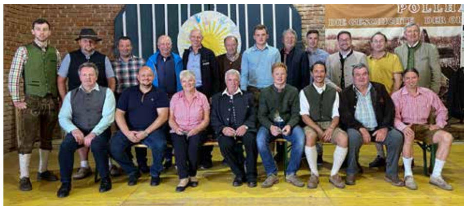
Lieferanten der prämierten Moste

Zum Abschluss noch ein großer Dank an alle Beteiligten der Veranstaltung, angefangen von den vielen freiwilligen Helfer*innen, der Pfarre Pollham, der Pollhamer Musi, dem Gasthaus pollhamerhof und allen, die uns unterstützt haben!