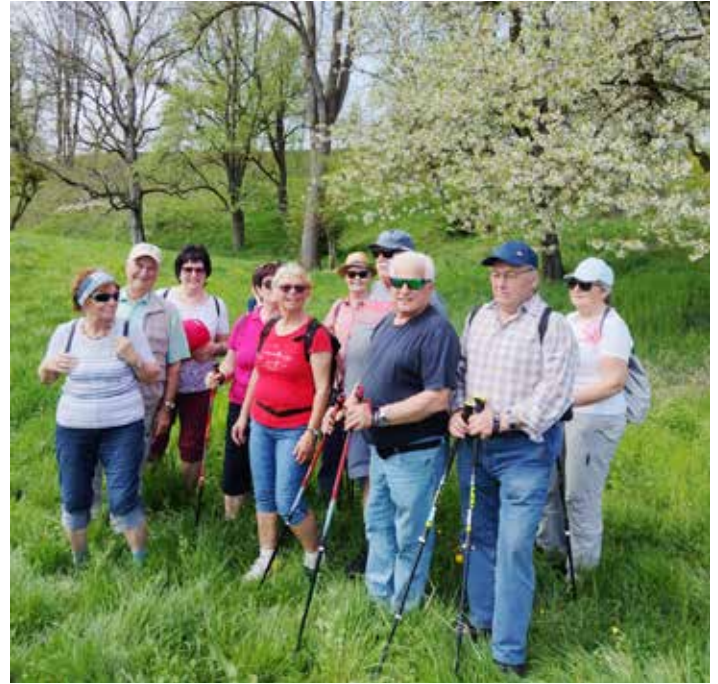
Wanderung 16. April 2025