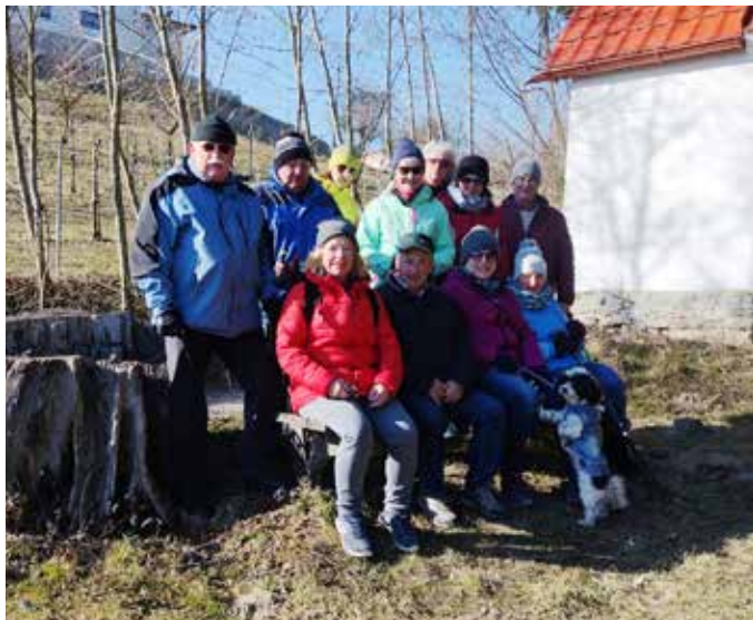
Wanderung 19. Februar 2025

An diesem traumhaft schönen Tag wanderten wir am 19. Februar 2025 mit 13 Senioren*innen von Wallern nach Bergern, über das Hochfeld