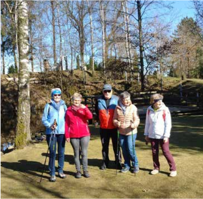
Wanderung 19. März 2025